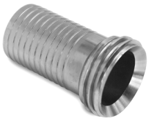
Raccordo maschio a fascettare DN 65 filetto trapezoidale

Male fitting to clamp DN 65 trapezoidal thread