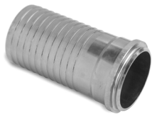
Raccordo femmina a fascettare DN 65 filetto trapezoidale

Female fitting to clamp DN 65 trapezoidal thread