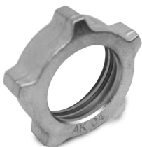
Girella filetto trapezoidale