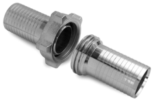
Raccordo completo a fascettare DN 65 filetto trapezoidale

Complete fitting to clamp DN 65 trapezoidal thread