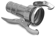
Raccordo femmina con portagomma tornito DN 65 mm testa 70 mm

Female fitting with machined insert DN 65 mm head 71 mm