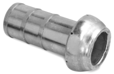
Raccordo maschio con portagomma tornito DN 65 mm testa 70 mm

Male fitting with machined insert DN 65 head 70 mm