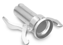
Raccordo femmina per tubo DE 84 mm