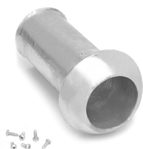
Raccordo maschio per tubo DE 84 mm