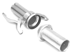
Raccordo completo per tubo DE 84 mm