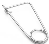
Spilla di sicurezza