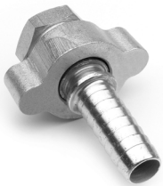
Raccordo filettato femmina NPT Female fitting NPT thread