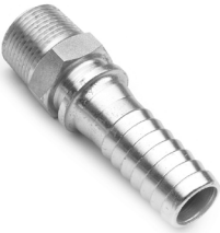
Raccordo filettato maschio NPT Male fitting NPT thread