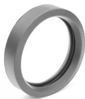
Guarnizione in gomma