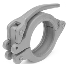
Giunto a leva