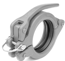
Giunto completo (giunto, guarnizione, spilla di sicurezza)

Snap coupling complete with gasket and safety pin