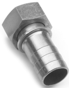
Raccordo filettato BSP Coupling BSP thread