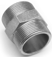
Nipple a doppio rodaggio conico filettato BSP Double wing nut BSP thread